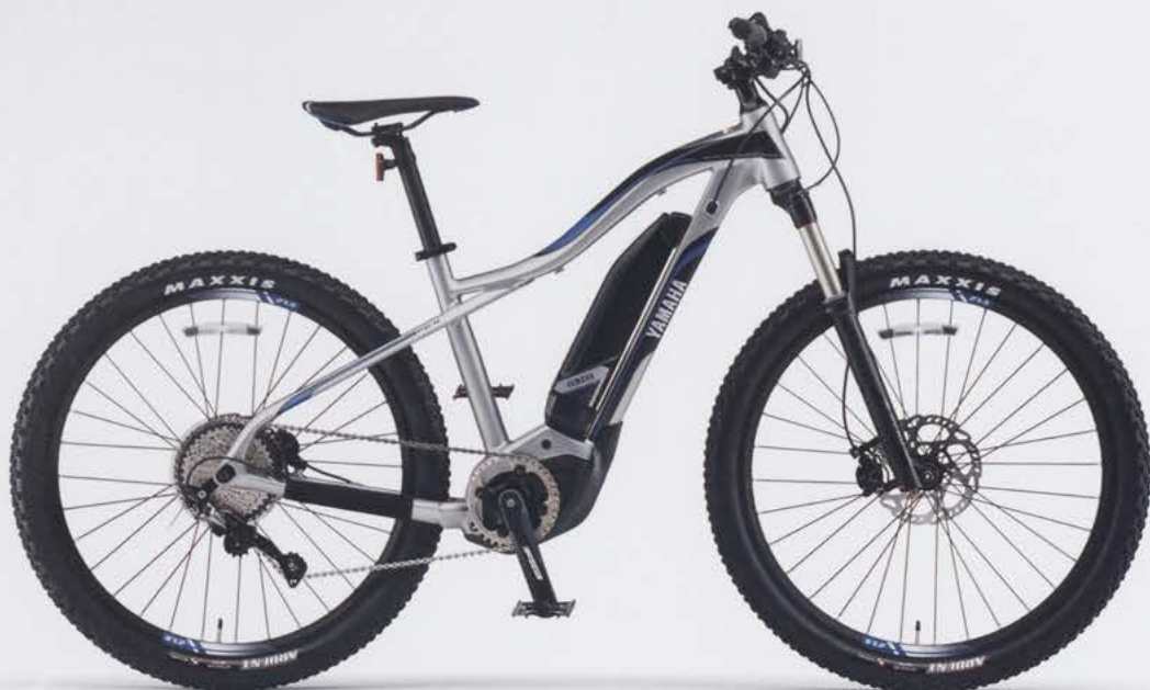
Mat Pure Silver (写真はM size)

E-MTB向けフラッグシップドライブユニット[PW-X]搭載。 ヤマハが培ってきた走りのDNAと、 パワフル&コントロールなアシスト性能を楽しむモデル。