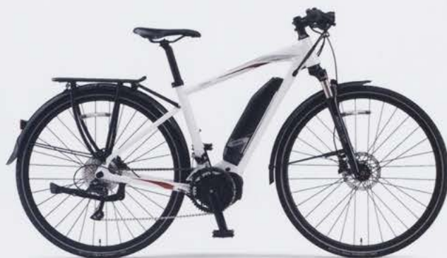
Pure Pearl White (写真はM size)