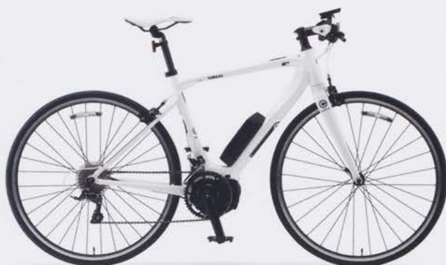
Pure White (写真はM size)