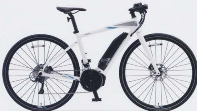
Pure White (写真はM size)