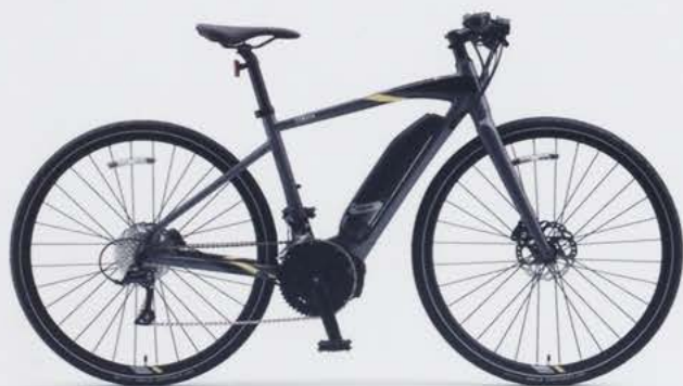
Mat Dark Gray (写真はM size)