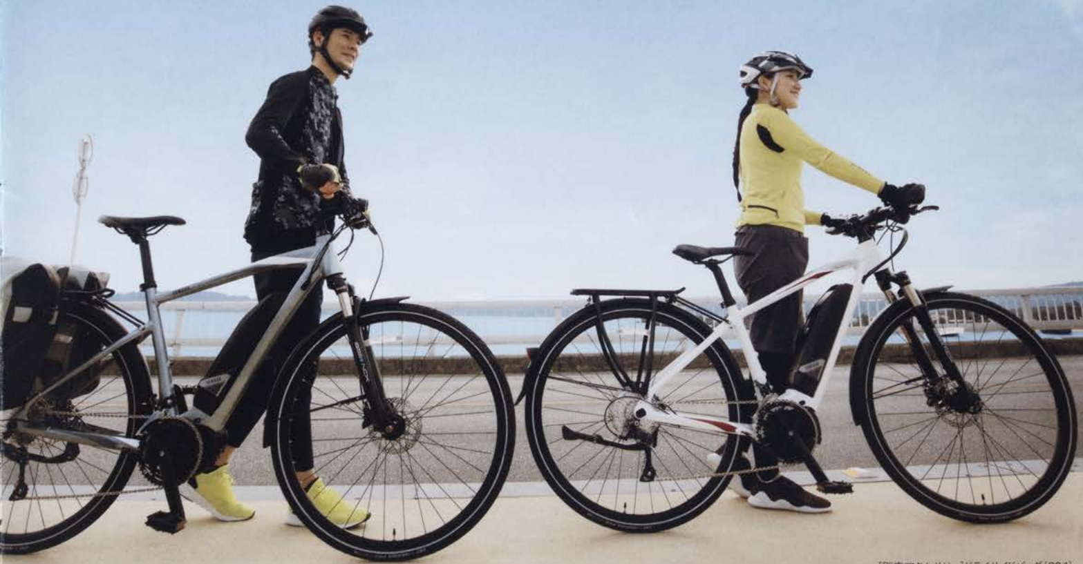
[別売アクセサリー]ドライサイドバッグ(20L)