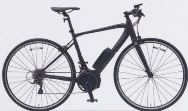
Matte Black (写真はM size)

PWFドライブユニットと小型軽量バッテリーをベースに、「軽さ」「デザイン」「巡航性能」を追究。 スポーツバイク本来の軽快感に加え、アシストによる心地よい加速フィーリングと走行性能を実現。 軽快な乗り心地とアシストの恩恵をバランス良く融合した電動アシストスポーツバイク。