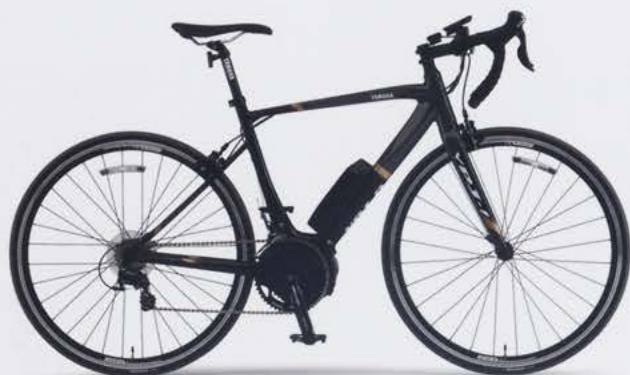
Solid Black / Dark Gray (写真はM size)

PWドライブユニットと小型軽量バッテリーをベースに、「軽さ」「デザイン」「巡航性能」を追及。 スポーツバイク本来の軽快感に加え、アシストによる心地よい加速フィーリングと走行性能を実現。 軽快な乗り心地とアシストの恩恵をバランス良く融合した電動アシストロードバイク。