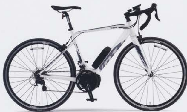
Pure Pearl White (写真はM size)