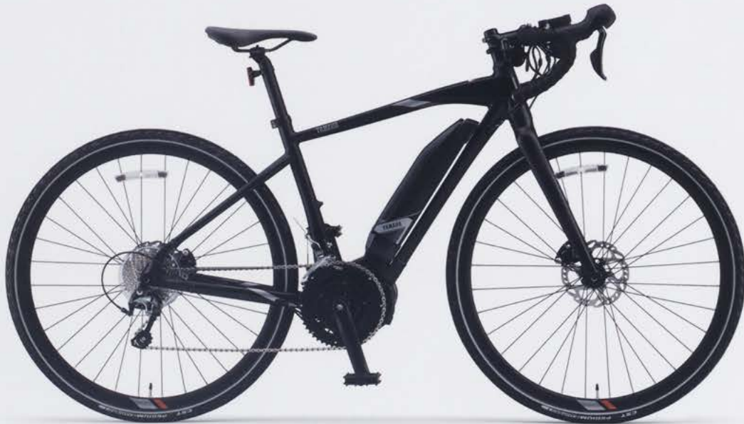
Mat Black 2 (写真はM size)