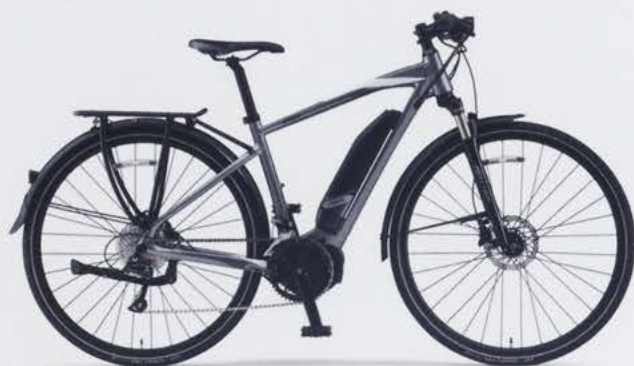
Satin Silver (写真はM size)

通勤や街乗りはもちろん、長距離ツーリングにも対応できるスペックと拡張性で、幅広いニーズに応えるオールマイティな1台。