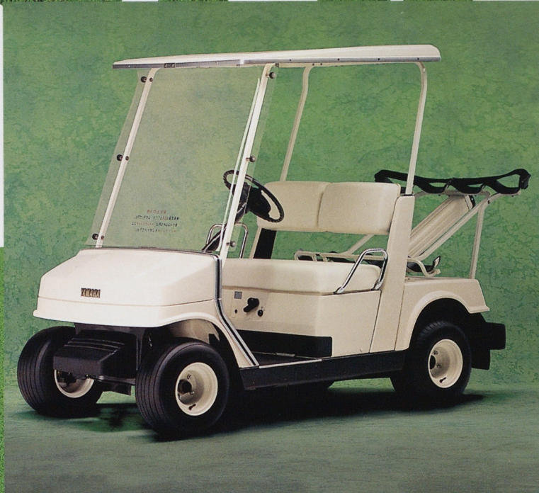
2人乗りゴルフカー〈G9-E エレクトリック・モデル〉