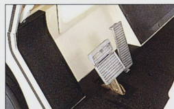
パーキングブレーキ&フットブレーキ