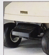
フロントバンパー