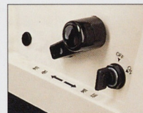
前・後進切り換えレバー