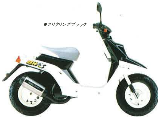
●グリタリングブラック