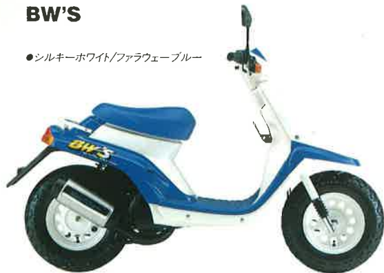
●シルキーホワイト/ファラウェーブルー