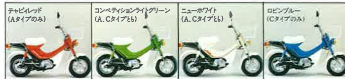
※ボディカラーは印刷のため実物と異なって見える場合があります。