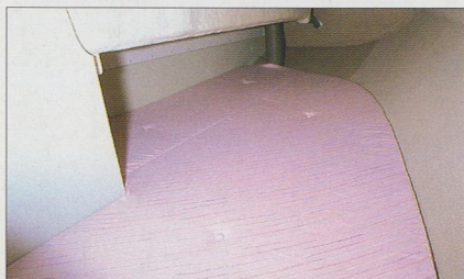
クォーターバース/2名分のスペースを確保。ゆったりした、くつろぎ空間とします。(写真はI/B-Sです)