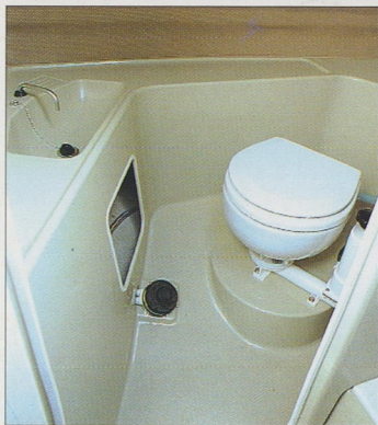
トイレ/内部はゆとりの広さの独立タイプ。マリントイレも標準装備しています。(O/B、I/B、I/B-Sに標準装備。)