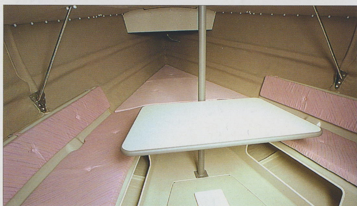
キャビン/25フィートクラスでは例を見ないレイアウトにより、キャビンは十分な室内幅、余裕のヘッドクリアランスを確保しています。(写真はI/B-Sです)