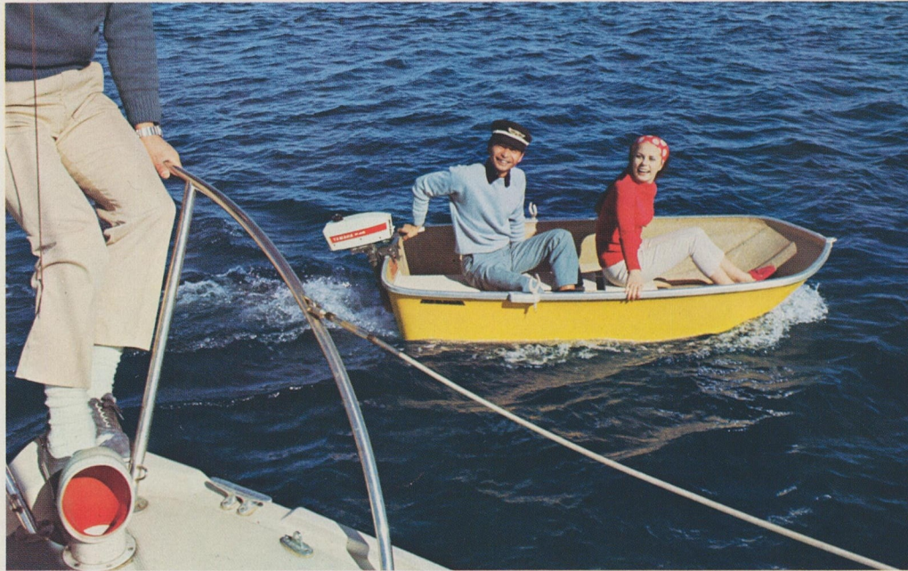
軽くて小回りのきくTRI-8は、大型ボートやヨットのテンダーにもピッタリ

船型は、アメリカやヨーロッパでも流行のトリマ ラン・タイプ。フロアが広く、安定がよく、ス マートで合理的な設計です。操作が簡単なヤマハ 船外機P-45（1.5馬力）とのコンビで新しいレジ ャーへスタートしてください。