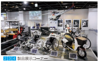
2 3 4 製品展示コーナー