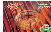
※プリペイドカードのイメージです。

静岡県内でチェーン展開している「炭焼きレストランさわやか」全店でご利用いただけるプリペイドカードです。